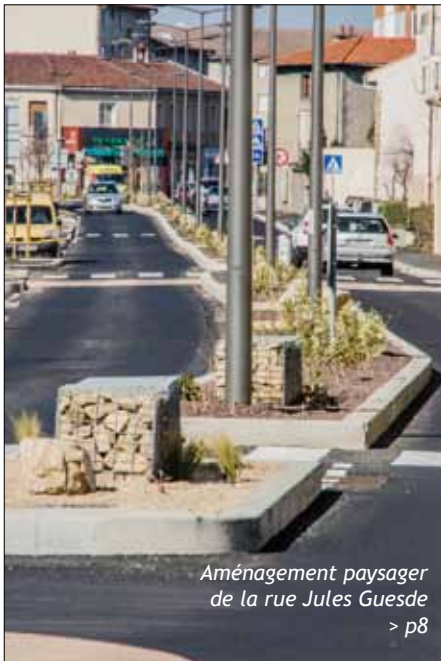
Aménagement paysager de la rue Jules Guesde > p8