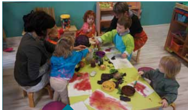
Un des ateliers d'activités organisé par le RAM pour les enfants avec leur assistante maternelle

Ce temps d'observation peut tout à fait s'inscrire dans le cadre de la formation professionnelle continue.