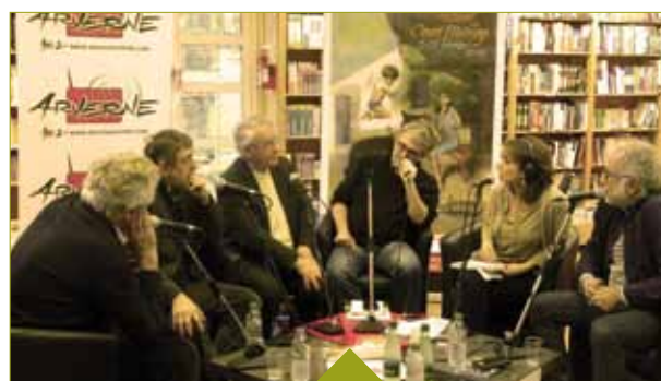
L'équipe de Radio Arverne à la librairie « Les Volcans » lors de l'édition 2016 du « Festival du Court Métrage »

Le Théâtre de l'Horloge est au regret d'avoir à reporter les représentations de son nouveau spectacle «Fish and Love» prévues les 12 et 13 mai 2016 au théâtre Cornillon et vous donne rendez-vous en janvier 2017