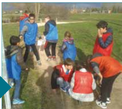
Course d'orientation durant les vacances d'hiver pour les enfants du centre de loisirs

En bref, créativité, sport et bonne humeur étaient de rigueur pendant ces vacances d'hiver !