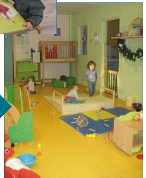
Un des espaces adaptés pour accompagner le développement des jeunes enfants au Magicabou

Contact Magicabou : Tél. 04 73 23 55 42 Courriel : lemagicabou@ville-gerzat.fr