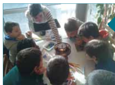
Animation «Court métrage» durant les vacances d'hiver

Du lundi au jeudi 8h/12h et 13h/16h30 - Vendredi 8h/12h