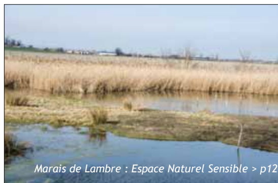
Marais de Lambre : Espace Naturel Sensible > p12