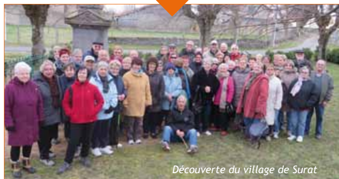
Découverte du village de Surat

• Les promenades pédestres du mardi après-midi ont permis à de nombreux adhérents de parcourir les chemins de la Plaine de La Limagne à la découverte des villages de Surat et Saint-Ignat ; autre destination : les Forts de la Sauvetat.