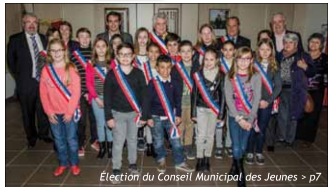
Élection du Conseil Municipal des Jeunes > p7