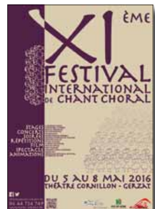
Du 5 au 8 mai > p22